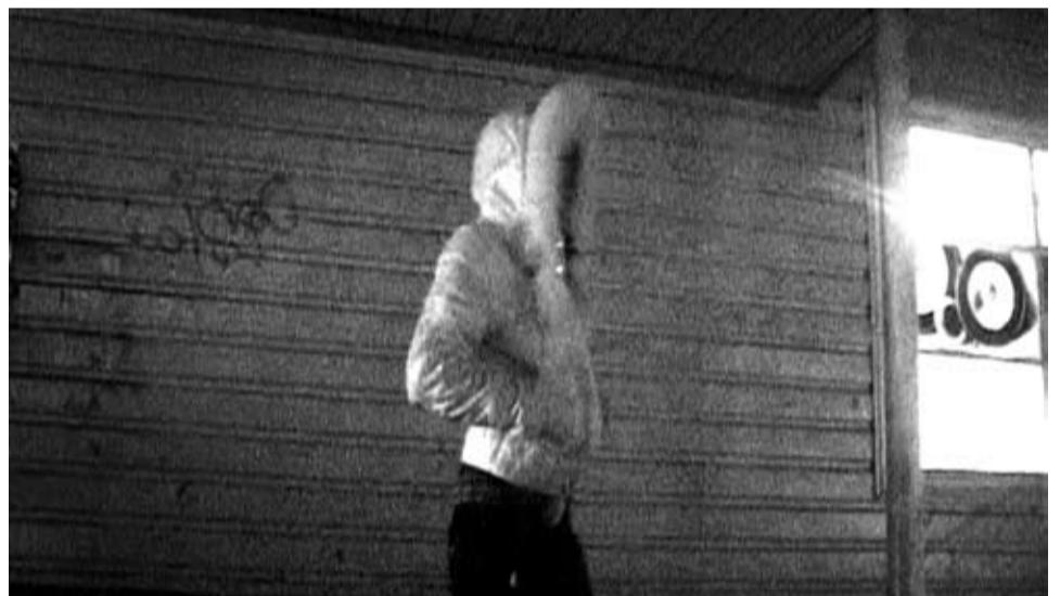
Кадр из фильма «Словно жду автобуса»