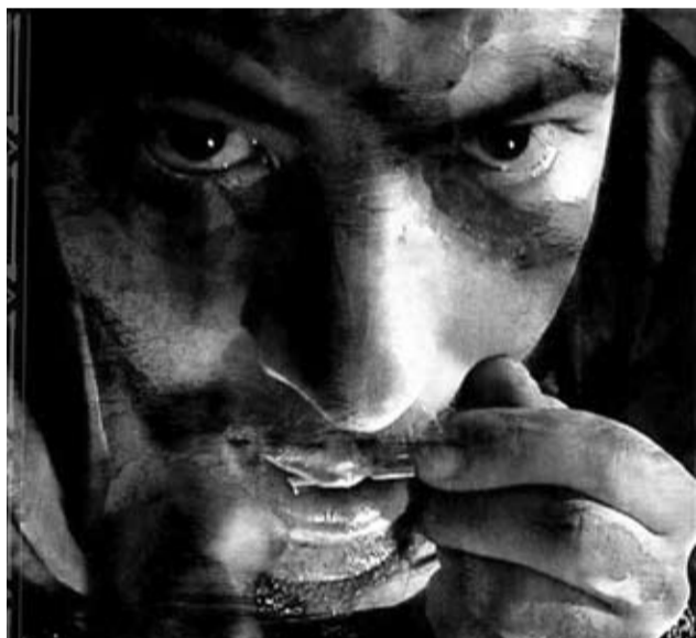
Кадр из фильма «ТАНЕЦ ГРОМА»