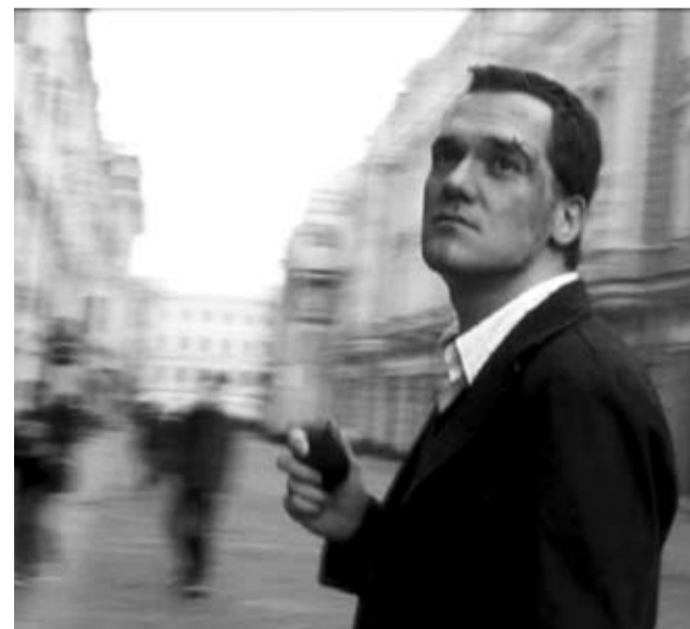
Кадр из фильма «Сотни дорог»