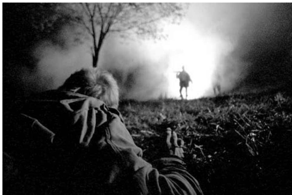
Кадр из фильма «Заберите своих мертвецов»