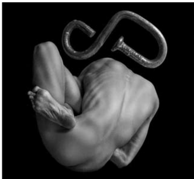
Кадр из фильма «МЕЛОДИЯ ДЛЯ ФЛЕЙТЫ»