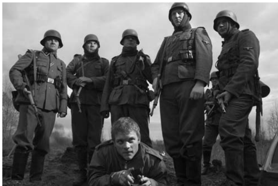
Кадр из фильма «Заберите своих мертвецов»