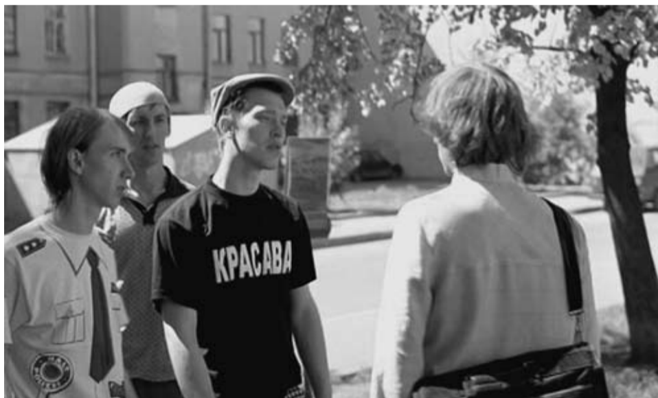
Кадр из фильма «ТАТРА»