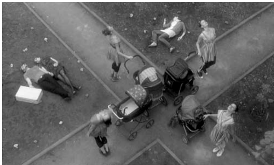
Кадр из фильма «ТАТРА»