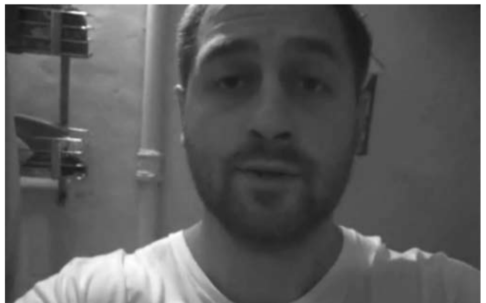
Кадр из фильма «СТИХИ. VOLGA DRIVE»

ВЕДУЩИЙ ПОКАЗА – РЕЖИССЁР ОЛЕГ ХАЙБУЛЛИН