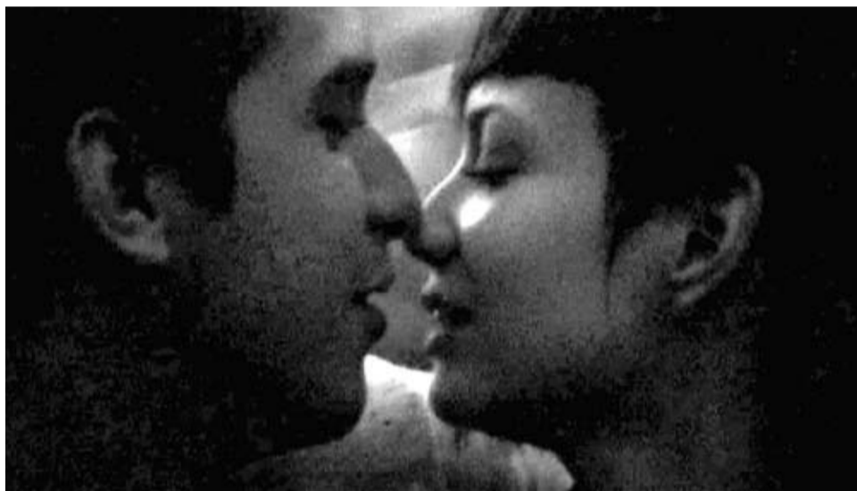
Кадр из фильма «В активном поиске»